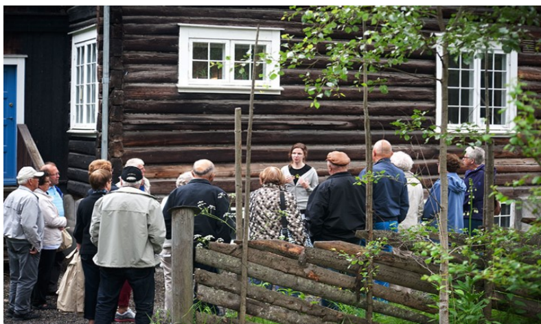
Omvisning på Bjerkebak